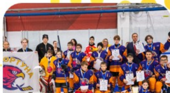
В Москве завершился II Открытый Московский Турнир среди слабовидящих и незрячих детей «Вызов Арктики»

Охват более 1 500 000 просмотров постов и видеотрансляций в социальных сетях