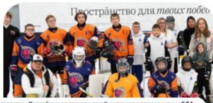
Астрахань: Хоккейные уроки для детей с нарушениями зрения и ОДА, репортаж ГТРК Лотос, Россия- 1 Вести Астрахань

II Открытый Московский Турнир среди слабовидящих и незрячих детей «Вызов Арктики» стал ярким завершением 2024 года и самым масштабным соревнованием в мире российского незрячего хоккея. ↗ 📄